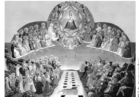
Fra Angelico – Das Jüngste Gericht, 15. Jh.

Allerdings bleibt die Frage, was da eigentlich wiedergeboren wird, da es der buddhistischen Lehre nach so etwas wie „eine Persönlichkeit, ein Selbst“ gar nicht gibt, sondern alles Sein miteinander verbunden ist (Inter-Sein). Die Vorstellung von der „Geburt- und Todlosigkeit“ besagt, dass nichts aus sich selbst oder aus dem Nichts heraus entsteht, sondern alles aus anderem hervorgeht und sich nach dem Tod in anderes verwandelt. Das hat durchaus ethische Konsequenzen, denn wenn man den Anderen nicht einfach als Anderen, sondern als Teil von sich selbst wahrnimmt, schadet man sich selbst, sobald man dem Anderen Schaden zufügt.