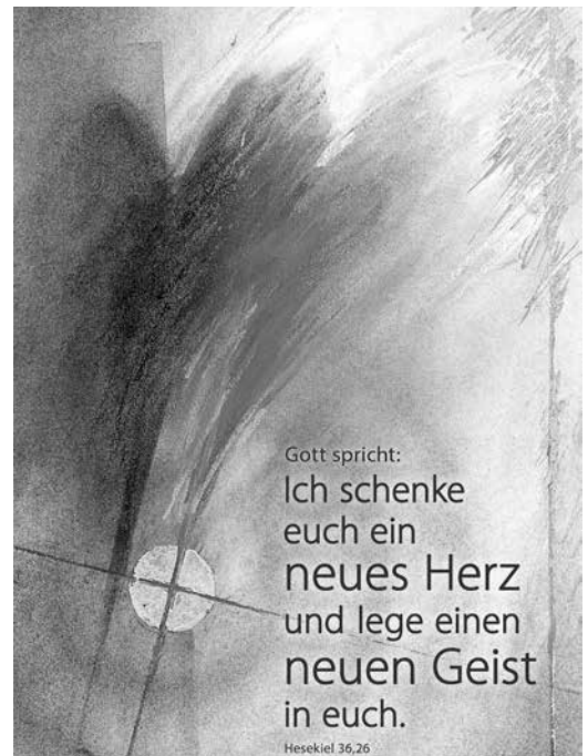
Bild: Motiv von Stefanie Bahlinger, Mössingen, www.verlagambirnbach.de

Der Prophet beschränkt sich nicht darauf, Missstände anzuprangern. Er entfaltet in der Jahreslosung eine großartige Verheißung: Der neue Anfang, nach dem wir uns in unseren Familien,