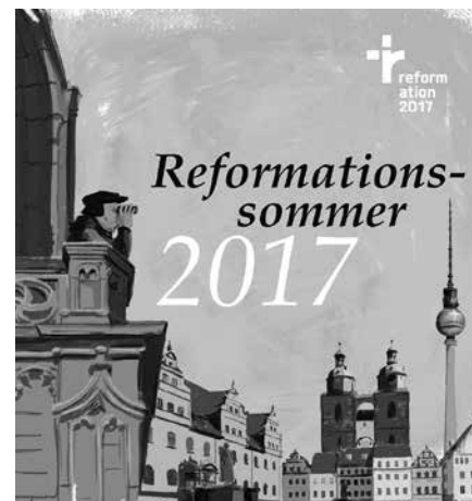
Bilder: Reformation 2017

Der Kirchentag ist Teil der Feierlichkeiten zum 500. Reformationsjubiläum.