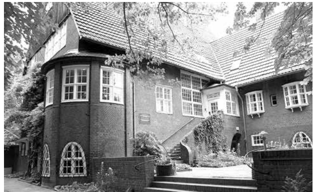
Pfarrhaus von Martin Niemöller

Handeln: In diesem Lernprozess werden Möglichkeiten entdeckt, um für Veränderungen einzutreten und sie im eigenen Umfeld umzusetzen. Die Erfahrung, selbst etwas tun zu können, ist gerade für junge Leute wichtig. Wir